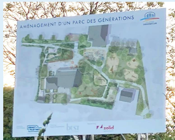
D'Foto ass en Dag virum Gemengerot gemaach ginn.

Aus dem Generatiounepark fir Kléng a Grouss soll e Park ginn ouni Spill a Spaass fir Kanner. All Spiller fir Kanner si verschwonnen a si just duerch 2 Schachspiller a 2 Dëschtennisdëscher ersat ginn.